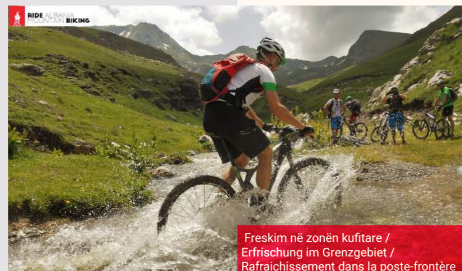
Freskim në zonën kufitare / Erfrischung im Grenzgebiet / Rafraîchissement dans la poste-frontière