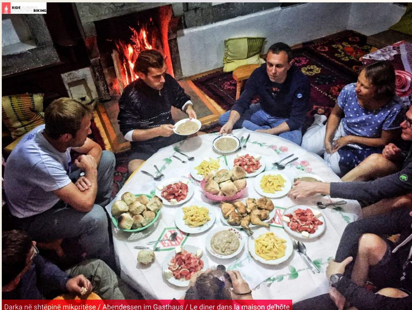
Darka në shtëpinë mikpritëse / Abendessen im Gasthaus / Le diner dans la maison d'hôte