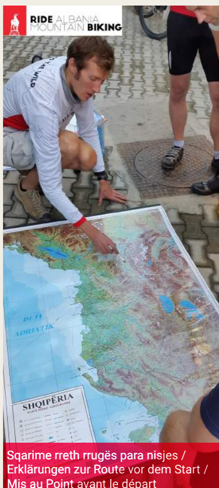
Sqarime rreth rrugës para nisjes / Erklärungen zur Route vor dem Start / Mis au Point avant le départ

Tobi vise principalement le marché d'Europe de l'Ouest et avec Ride Albania Mountain Biking, il offre un produit de qualité et sécurité suisse: des guides certifiés en passant par les vélos à louer entretenus de façon parfaite et jusqu'au véhicule de soutien pour les valises, réparations et urgences. Ainsi, pendant une semaine de mountain bike en Albanie, il s'occupe de tout, en commençant par prendre les visiteurs à l'aéroport/au port et jusqu'à la fin du périple à ces mêmes endroits. C'est une