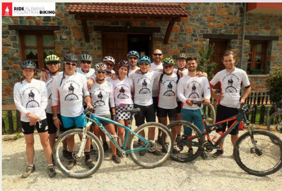
Me një grup italian / Mit einer italienischen Gruppe / Avec un groupe italien

dhe të drejtpërdrejtë – dhe vendës me mikpritjen e tyre të mrekullueshme. Për mysafirët nga një botë e pasur dhe e ngopur, një përvojë pothuaj ekzistenciale».