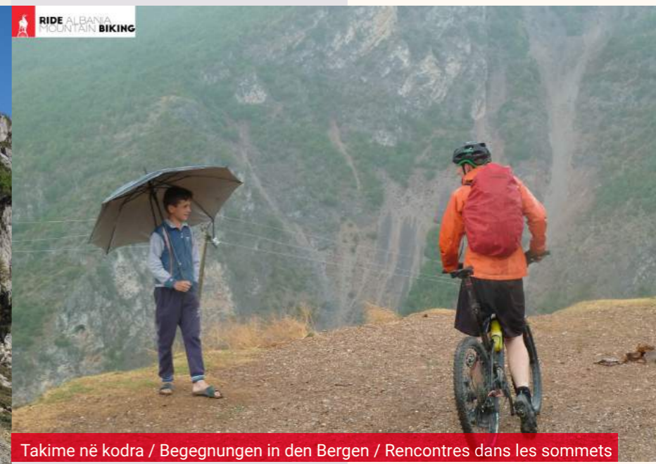
Takime në kodra / Begegnungen in den Bergen / Rencontres dans les sommets

Tobi sapo ka përfunduar një tur me mysafirët nga Zvicra dhe Gjermania. «Java e