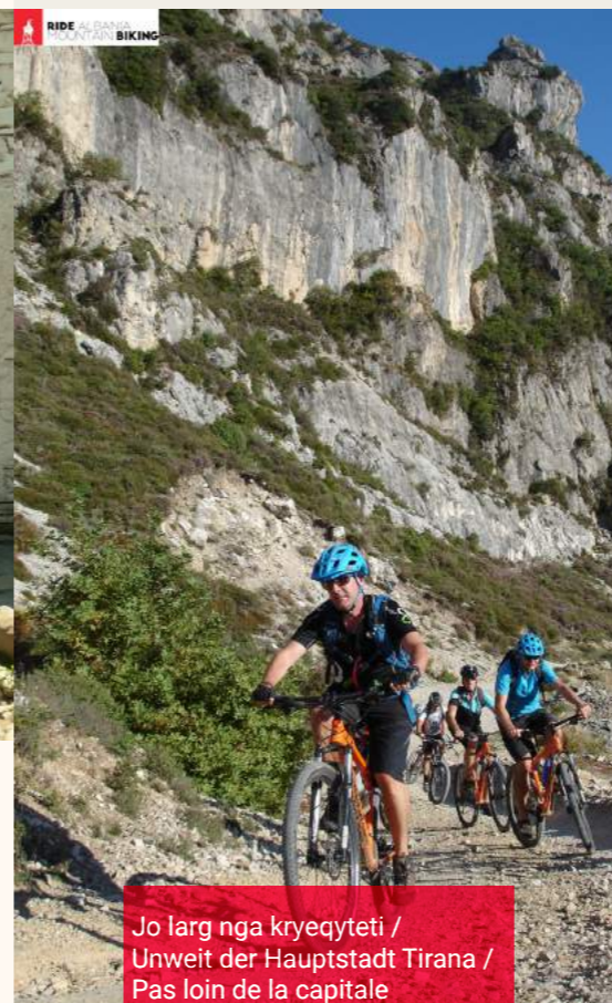
Jo larg nga kryeqyteti / Unweit der Hauptstadt Tirana / Pas loin de la capitale